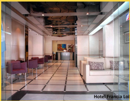
Hotel Francia Lo

El Hotel está situado en centro de Tucumán, a poca distancia a pie las boutiques y galerías de la zona peatonal de San Miguel de Tucumán. Las habitaciones son prácticas y están decoradas con suelo de moqueta y colores llamativos. Todas disponen de aire acondicionado, TV por cable y conexión Wi-Fi gratuita. Además ofrece cuna para bebe sin cargo (con pedido previo); depósito de equipaje las 24 horas; moderno ascensor (capacidad 8 personas); cochera cubierta y vigilada las 24 hs.